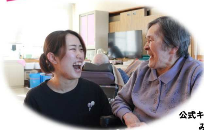
公式キャラクター みこちゃん